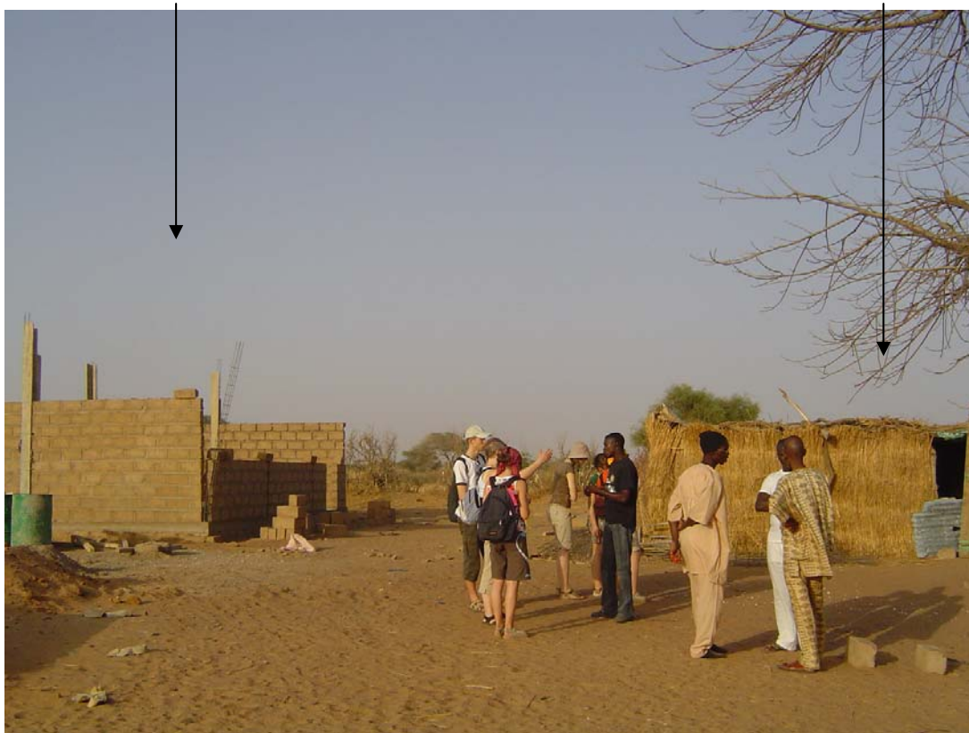
L'école avant .