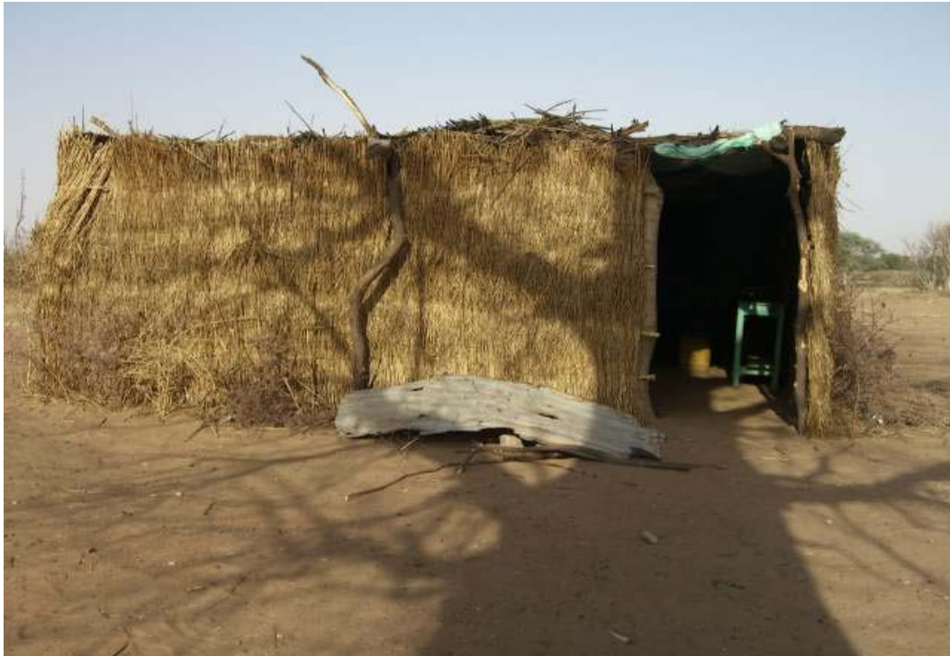
Pâques 2007 : le chantier de Thiallène